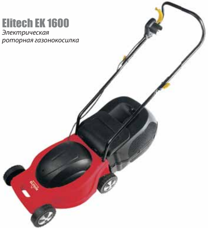
Elitech EK 1600 Электрическая роторная газонокосилка

Колеса резиновые, для мягкого хода по траве, причем задняя пара увеличенного размера по сравнению с передней, что удобно при маневрировании по неровной поверхности. Небольшой вес позволяет без лишних усилий перемещать косилку (машина «толкаемая», без привода на колеса). Рукоятка складная.